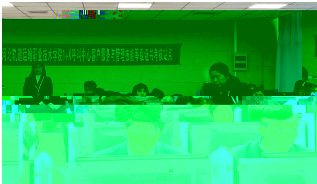
2 1+X 中 与 书