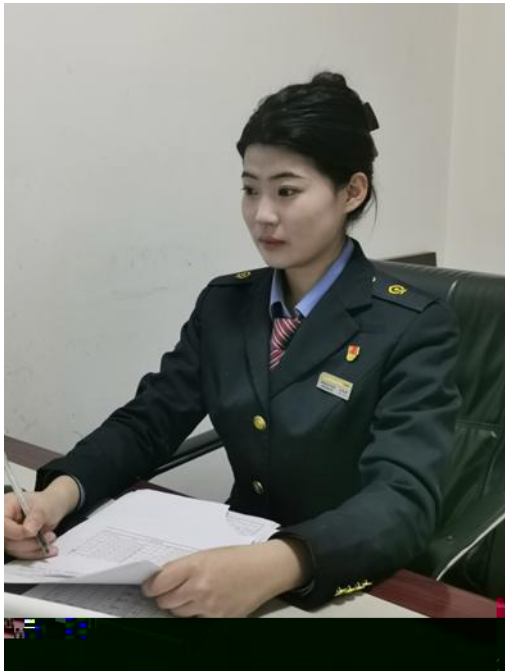
5 业 于