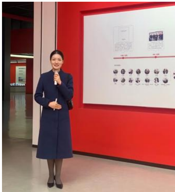
6 业 于